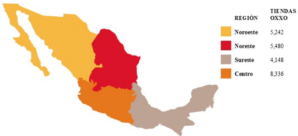
Tiendas OXXO Ubicación Regional en México Al 31 de diciembre de 2024

Históricamente, la División Proximidad Américas ha expandido en forma rápida el número de tiendas OXXO. Durante el 2024 y 2023, la División Proximidad Américas retomó un ritmo orgánico de expansión comparable al anterior a la pandemia COVID-19 y los efectos relacionados en el comportamiento del consumidor. Alcanzó esto enfocando el crecimiento en áreas de alto potencial económico en mercados existentes, y expandirnos en mercados con baja penetración e inexplorados.